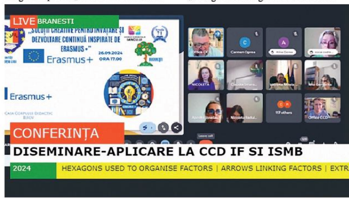
Pagină coordonată de prof. dr. Florin PETRESCU, director al CCD Ilfov

Vă așteptăm să vă alăturați comunității noastre de dezvoltare prin Erasmus+, din București și Ilfov, pentru a fi parte din această poveste minunată! Puteți participa la cursurile de formare prin Erasmus+ la CCD Ilfov, online, gratuit. ■