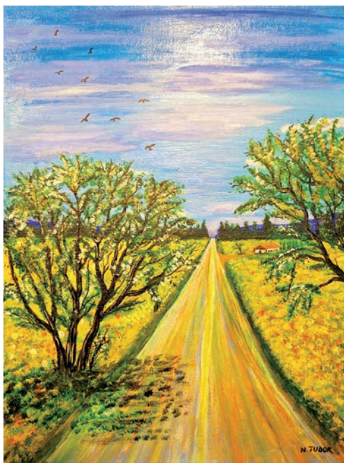
Ilustrație, pictură Nicoleta Tudor

Să le dăruie iubire Când aceasta va fi coaptă S-o servească din potire.